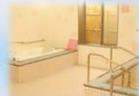
温泉気分でゆっくりと入浴できる 大浴場