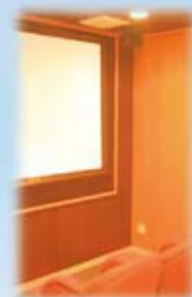
好きな時間に映画を楽しめる シアタールーム

みなさんこんにちは。介護付有料老人ホーム『ラ・ナシカもりまつ』です。早いもので、開設して、1年がたちました。ご入居者も増え、ますます元気に生活していただいています。ラ・ナシカでは、トレーニングによる介護予防、機能維持などを積極的に行うなど専門のトレーナーがご入居者の元気な体作りをサポートしています。もちろん当施設は、『介護付』ですので、介護認定をお持ちの方しかご入居いただけません。一人で歩くのに不安のある方から寝たきりの方まで、ご自宅での介護でお困りのかた、お気軽にご相談ください。ラ・ナシカは、ご自宅とできるだけ同じ生活をしていただくために、様々なご要望にできる限りお応えしていきたいと考えています。介護が必要になったとき、また不安を感じたときなど、もっと地域の方々に、気軽に利用していただけたらと考えています。『ここからの介護』をモットーにスタッフ一同心よりお待ちしております。