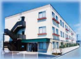
気の合った仲間と談話ができる 明るく開放的な建物

みなさんこんにちは。介護付有料老人ホーム『ラ・ナシカもりまつ』です。早いもので、開設して、1年がたちました。ご入居者も増え、ますます元気に生活していただいています。ラ・ナシカでは、トレーニングによる介護予防、機能維持などを積極的に行うなど専門のトレーナーがご入居者の元気な体作りをサポートしています。もちろん当施設は、『介護付』ですので、介護認定をお持ちの方しかご入居いただけません。一人で歩くのに不安のある方から寝たきりの方まで、ご自宅での介護でお困りのかた、お気軽にご相談ください。ラ・ナシカは、ご自宅とできるだけ同じ生活をしていただくために、様々なご要望にできる限りお応えしていきたいと考えています。介護が必要になったとき、また不安を感じたときなど、もっと地域の方々に、気軽に利用していただけたらと考えています。『ここからの介護』をモットーにスタッフ一同心よりお待ちしております。