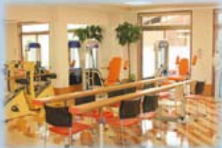
トレーニングマシンが充実した リハビリ用のトレーニングルーム