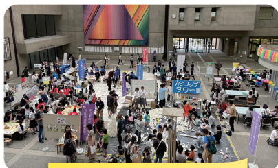
保育のおしごとフェア