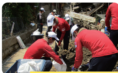
災害時のボランティア活動