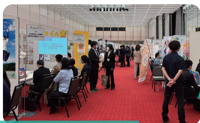
福祉の就職総合フェア

福祉人材の確保・定着を進めるためのマッチング支援や研修、福祉の魅力発信に取り組んでいます。